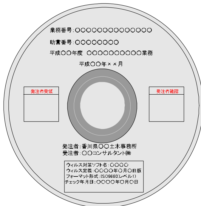
図 7-1 電子媒体への表記例