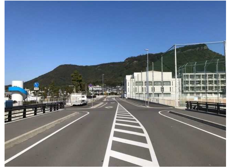
市道高松海岸線(高松市)