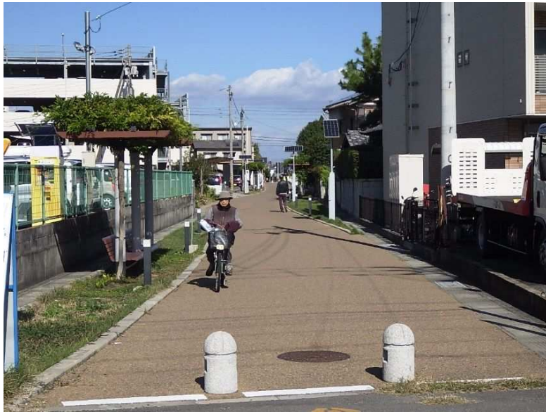
市道東臨港2号線(坂出市)