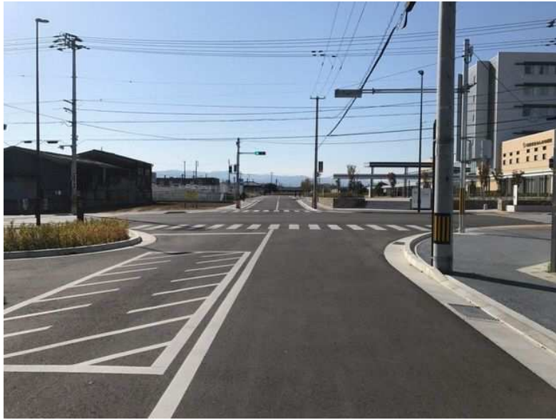
市道仏生山町8号線(高松市)