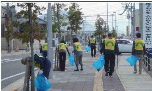
大学通り楓の会（三豊市）

（コメント）県道沿いのゴミの回収及び除草を年6回（偶数月）実施しています。参加人員は、年間約500名程度です。活動場所は、交通量の多い県道沿いであるため車に注意しながら活動しています。