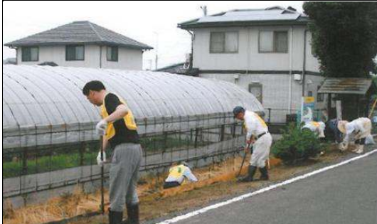
本大、内間環境美化クラブ（観音寺市）

（コメント）本校は「地域に開かれた学校づくり」を推進しており、そのひとつとして学校周辺の通学路である県道等の清掃奉仕活動を積極的に実施しています。各学年ごと年2回実施しており、この活動を通して、生徒の環境美化への関心、社会道徳観念や奉仕の精神を高めることに取り組んでいます。