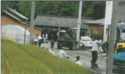
中田井環境美化クラブ（観音寺市）

（コメント）本大上自治会の住民を中心に結成され、年6回、延べ700名弱の人員で県道沿いの散乱ゴミの清掃や除草作業を実施しています。また、併せて、国道、市道、河川の美化活動も実施しています。