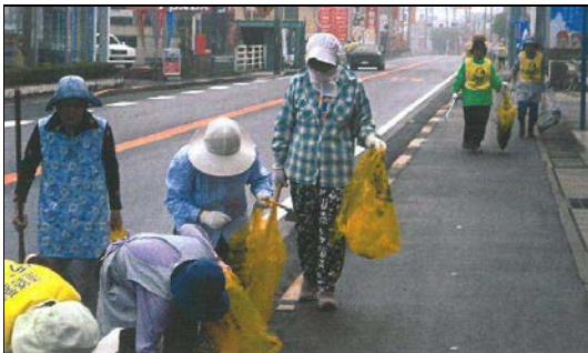
吉岡美化クラブ（観音寺市）

（コメント）中田井環境美化クラブは、中田井町自治会加入者を構成員とし、8月より偶数月、年4回（8、10、12、2月）を対象に環境美化運動（空き缶拾い）を実施しています。また、5月に河川清掃を行い河川沿いの雑草の除去。一ノ谷池堤防（つつじ）小池（水仙）の草刈を年3回に分け行い環境美化運動を実施しています。