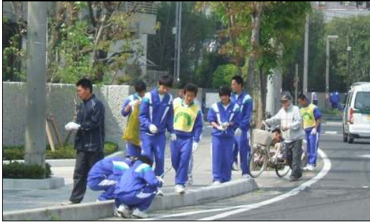
香川県立観音寺中央高校（観音寺市）