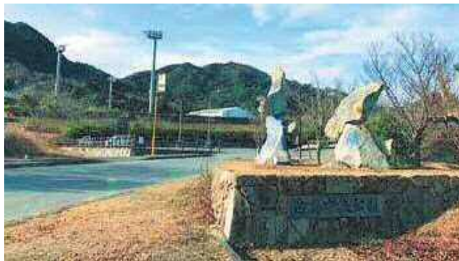
▲瀬戸内海を望む風光明媚な高台