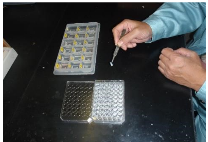
サワラの耳石調査