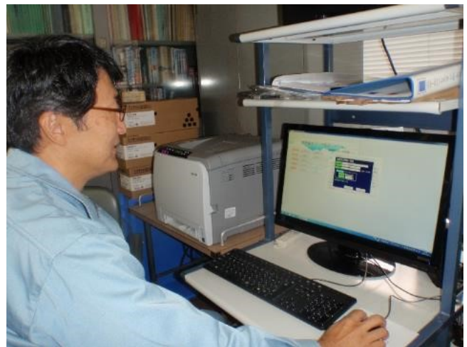
漁獲情報システム

国連海洋法条約の発効に伴う新漁業管理制度を円滑に進めるため、県内の重要魚種の漁獲量をコンピュータ・ネットワークを用いて管理しています。