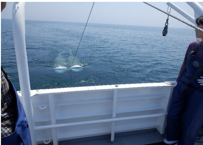
ボンゴネットによるカタクチイワシ稚魚調査

Research and investigation on fishery resources are required to preserve and enhance these fluctuating resources.