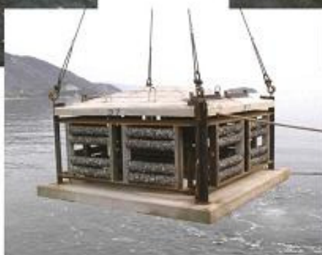
種々の藻礁の設置状況