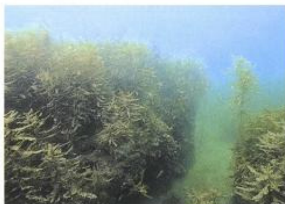
藻礁に生えたガラモ