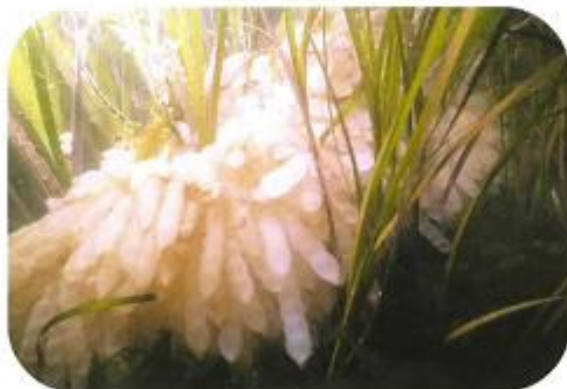
アマモに産み付けられたアオリイカの卵