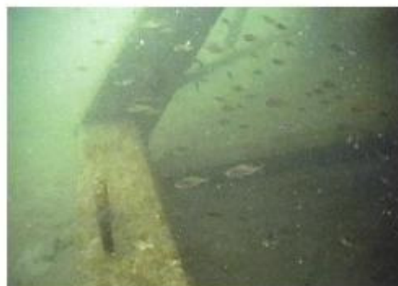
藻礁内に生息するメバルなどの稚魚