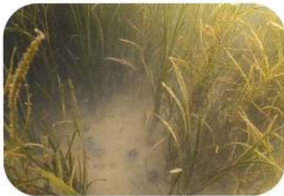
アマモ場で育つ稚魚