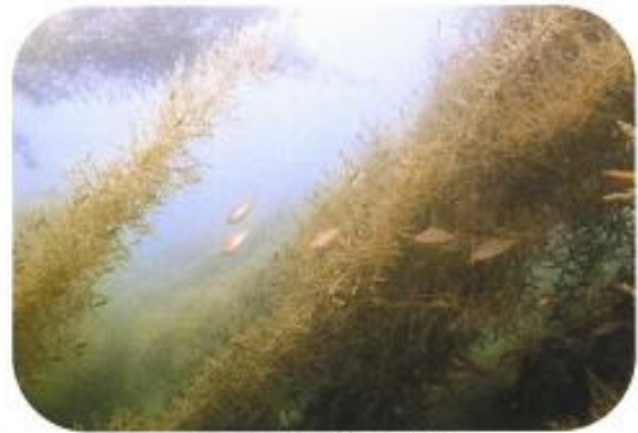
ガラモ場で育つ稚魚