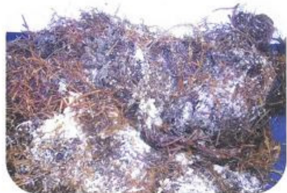
流れ藻に産み付けられたサヨリの卵