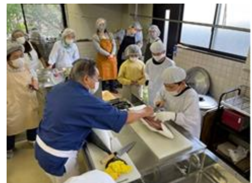
料理教室で小学生が魚の捌き方を学ぶ