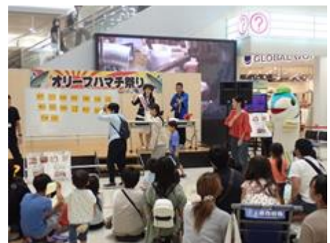
県内量販店でのフェア(オリーブハマチ祭り)