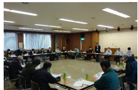
資源管理に関する漁業者検討会