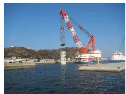
防波堤(ケーソン)の整備