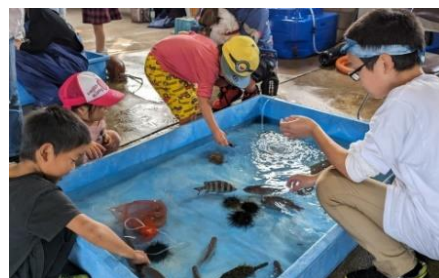
津田港わくわくフェスティバル （お魚タッチプール）