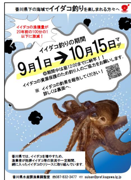
イイダコ資源保護の啓発チラシ