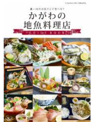
かがわの地魚料理店(改訂版)