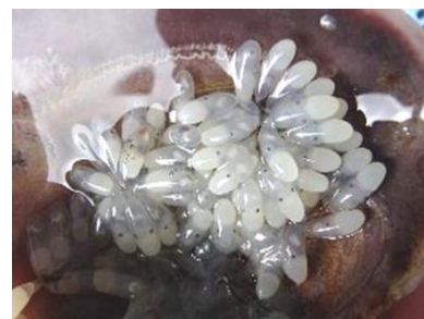
貝殻中のイイダコ卵

イイダコ：資源の回復に向け、漁業者が実践可能な資源造成手法を検討するため、産卵床（卵が付着した貝殻）やふ化稚ダコの安定生産に取り組み、令和5年度は730個（推定卵数：約22万粒）の産卵床を放流した（目標は500個）。また、稚イイダコ1,000個体の生産に成功し、放流を実施した。