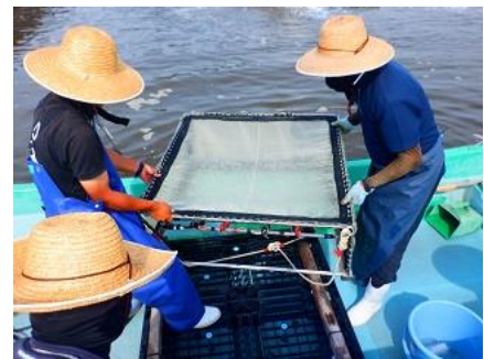
「電極付き小型桁網」によるエビの取り上げ