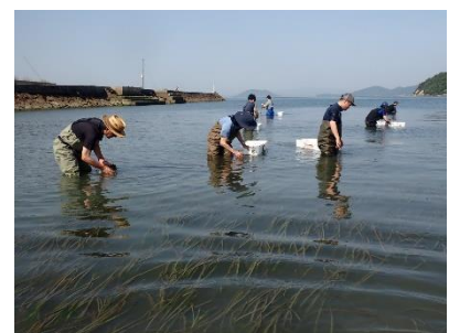
生島湾でのアマモの種取り