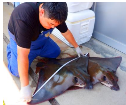
ナルトビエイの生物測定