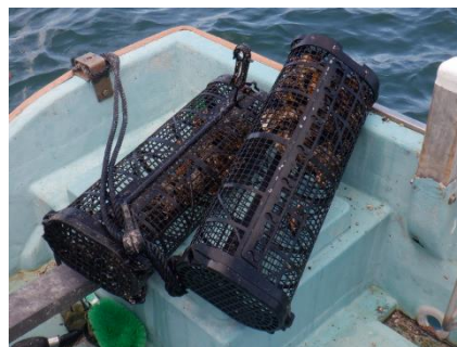
バスケットを用いた三倍体カキ養殖