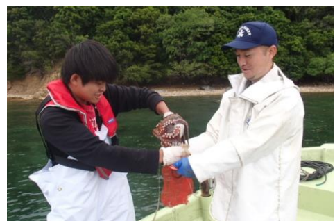
かがわ漁業塾でのたこつぼ縄漁の体験