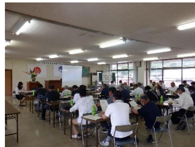
防災研修会の様子