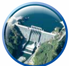
早明浦ダム(高知県)

高さ106メートルの四国地方で最大のダムです。香川用水もこのダムの水を利用しています。