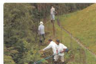
超急傾斜農地保安全管理加算 (超急傾斜農地における農業生産活動)