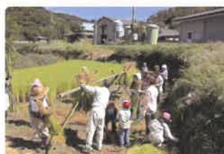
棚田地域振興活動加算 (棚田における収穫イベント)