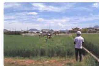
スマート農業加算 (ドローンの活用)