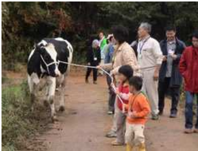
牛の散歩を楽しむ子供たち