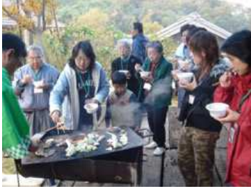
ステーキの大きさにびっくりする参加者たち