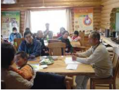
広野さんの話を交えながらミーティング