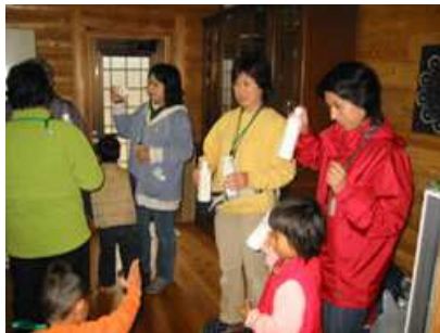
ペットボトルを振ってバター作りを楽しむ参加者たち

○ 最後にアンケートにお答えいただき、かがわ型グリーン・ツーリズムの推進に向け貴重な意見を収集することができました。