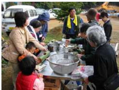
竹めし作りを楽しむ参加者