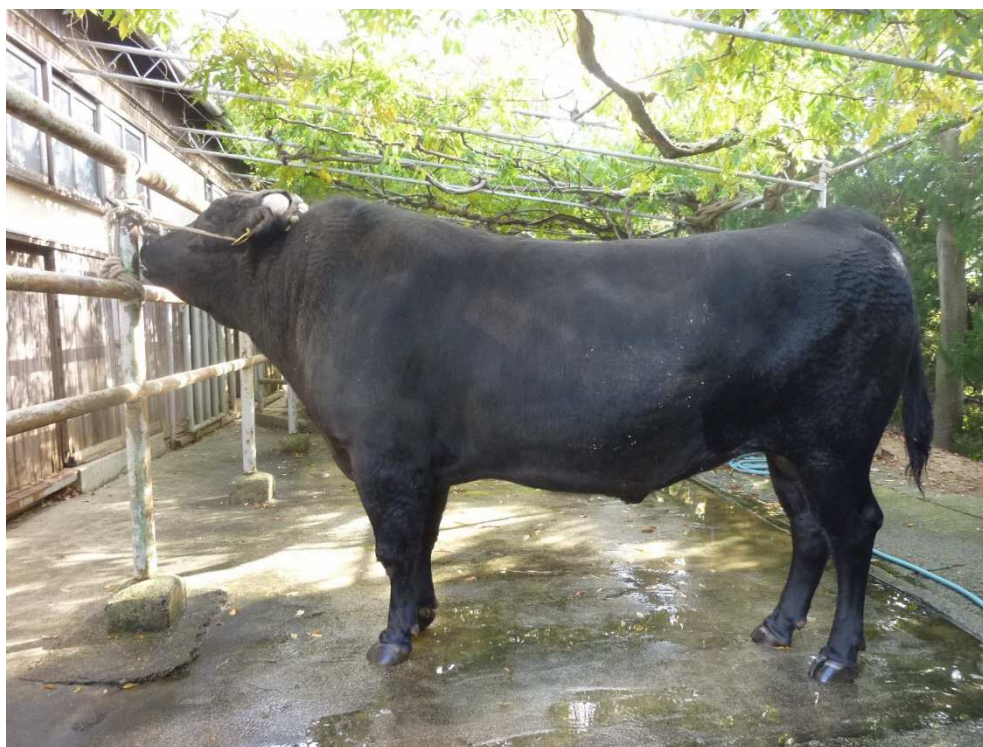
「讚岐安福」号 (平成 29 年 11 月)