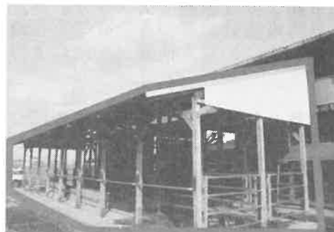
（写真）増築（軒出し）の例 →

このほかにも、酪農場に対しては、牛ウイルス性下痢・粘膜病や牛白血病対策の事業がありますので、疾病対策にご興味のある方は、家畜保健衛生所にお問合せ下さい。