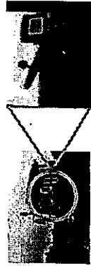
【GPS自動操舵システムの導入】