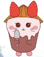
農大キャラクター マンチベリー15世