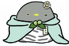
農大キャラクター のぎすさん

〒766-0004 香川県仲多度郡琴平町榎井34-3 TEL (0877) 75-1141(代) FAX (0877) 75-3989 E-mail: nodai@pref.kagawa.lg.jp