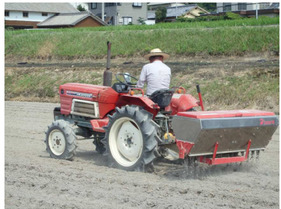
てんろ苦土石灰散布

平成25年度に現地実証ほを設置し、pHを矯正した生産者は、別のほ場では薬剤防除や耐病性品種による対策にも取り組んできた。しかし、3年間の実証の結果、てんろ苦土石灰によるpHの矯正は長期間に渡って根こぶ病の発生を抑制できることが確認され、資材に要するコストを考慮しても数年作付する場合は回収できると考えられることから、現在ではpHの矯正による対策で面積拡大を図っている。