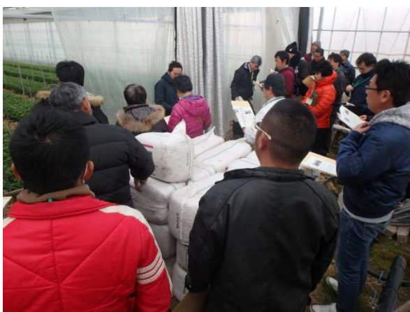
若手農業者の取組み調査

幅広い知識を習得することができるよう、普及センターが開催する農業経営管理講座、経営発展セミナー、経営研修会、若手農業者の取組みなどを調査する研修会や、香川県農業士等との交流会への参加を誘導した。