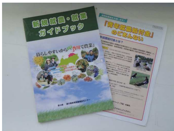
新規就農・就業ガイドブック等

また、面談時間の調整が可能な場合は、市町や農協などの関係機関と連携して面談を実施した。