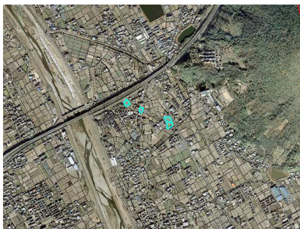
遊休農業経営資産情報システムの画面