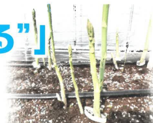
施設アスパラガス