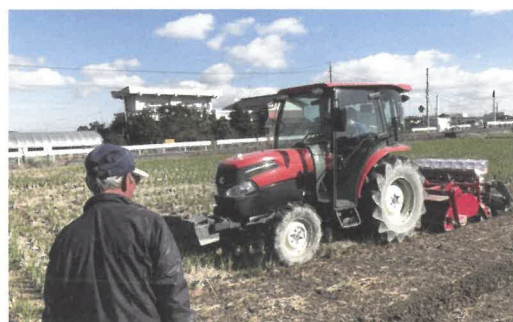
令和2年度に導入した逆転ロータリー