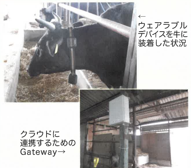
クラウドに連携するためのGateway

畜産では、牛の首に活動情報を収集するウェアラブルデバイスを装着し、発情発見率を向上させ、繁殖成績の向上を図っています。