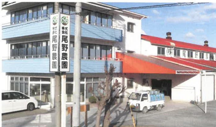
写真左側：善通寺市の(株)尾野農園本社と尾野社長 (上段写真、提供 RNC)