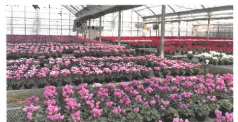
農林水産大臣賞受賞 (ガーデンシクラメン(鉢花・観葉植物(立毛)))