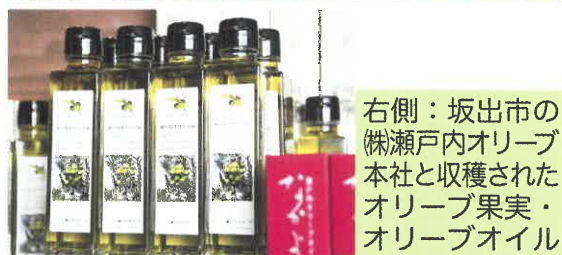
右側：坂出市の (株)瀬戸内オリーブ 本社と収穫された オリーブ果実・ オリーブオイル

GAPは「農産物の安全」や「環境保全」、「労働安全」に配慮して農業生産活動の持続的な改善に繋げる農場管理の取組みです。GAPには色々な種類がありますが、生産や販売に携わらない審査機関が定められた基準に基づき認証取得の審査を行うGLOBALG.A.P.とASIAGAP、JGAPを国際水準GAPと呼んでいます。