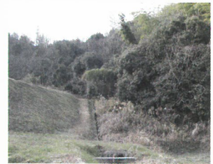
農地に近い藪は絶好の隠れ家