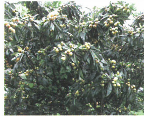
食べない家庭果樹の伐採等