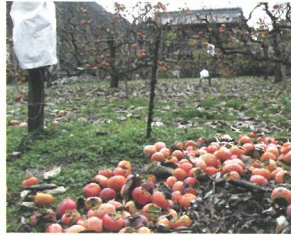
残渣は食べられないように処分