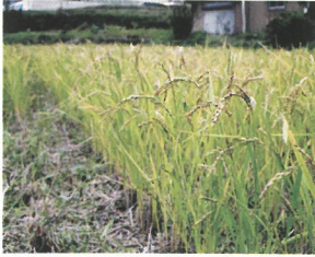
水稻の2番穂は早めにすき込み

集落に野生動物がやってくる要因は、安全で安心してエサが食べられることが理由です。「安心」と「エサ」を取り除き、集落のエサ場としての魅力を下げましょう。一人ひとりができることから取り組みましょう。