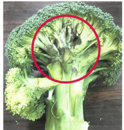
花蕾の黒褐変症状