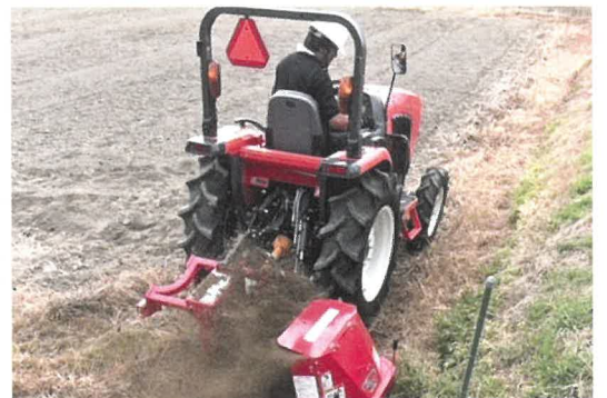
溝掘機を用いた作溝作業

定期的な 耕起で雑草対策 をしておくほか、降雨に備えた 排水溝を落としまで 通しておきましょう。