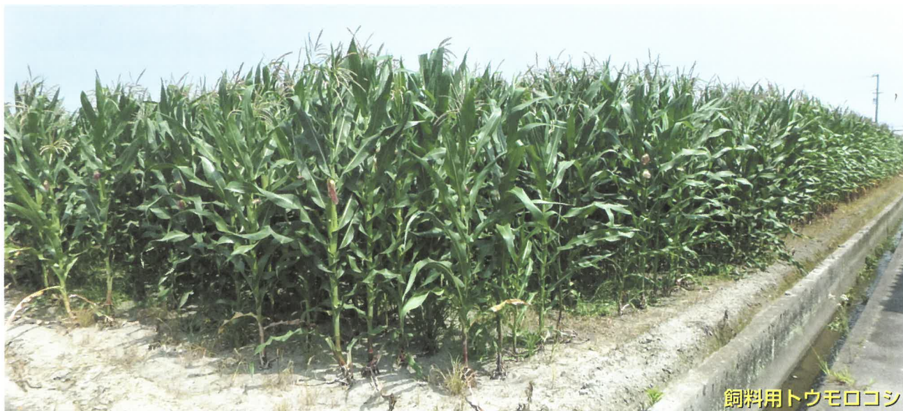
飼料用トウモロコシ