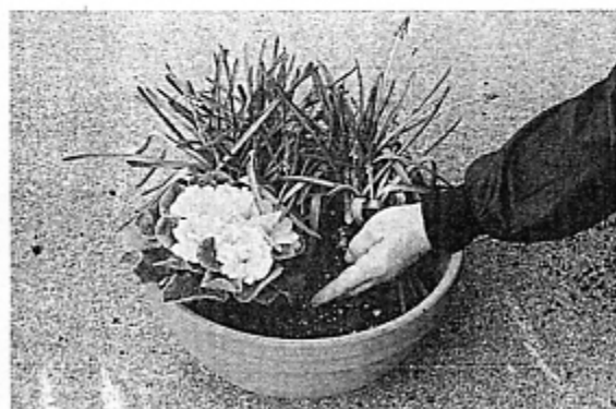
▲③プリムラを左端に置く。いったんここで鉢の間に用土を入れる