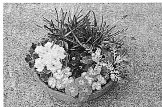
⑤水をまんべんなく十分にかける