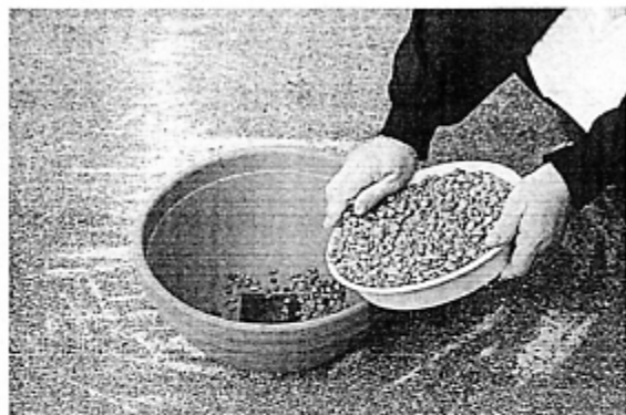
▲①底にネットをしき、厚さ2~3cm程度にゴロ土を入れる