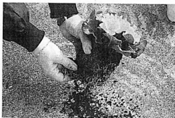
▲鉢底に根の巻いているものは少しほぐしてやる