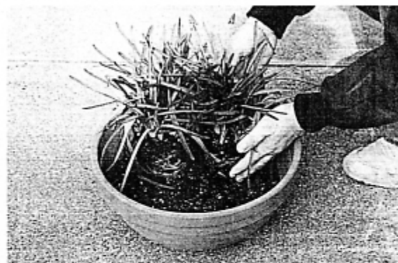
▲②ポールの一番後ろにムスカリを並べて置く