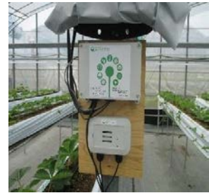
例：イ刀ハウスへのクラウドシステムによる施設内管理