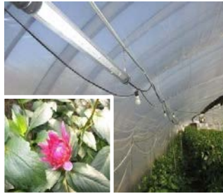
例：LEDとダリア新品種の導入