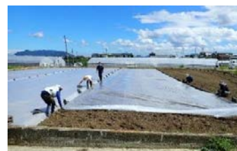
土壌消毒用資材の被覆