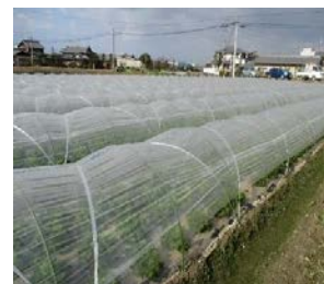
例：耐久性資材 (トンネル資材)