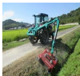
例：農業用設備 (トラクター用 アーム式草刈機)

認定農業者、新規就農者(認定新規就農者又は人・農地プランに位置付けられた就農5年以内の中心経営体)及び認定農業者となることが確実と認められる集落営農法人等