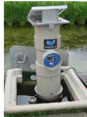
多機能型自動給水栓 (稲作の水管理を自動化・遠隔操作化)

パイプライン実施済地区における多機能型自動給水栓の設置やポンプ施設の除塵機設置 等