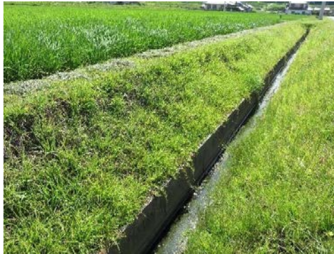
カバープランツ（ムカデ芝）

整備済の農地・農道・水路やため池の法面にカバープランツ（地表を覆うように育つ植物）や防草シート等の施工、急傾斜や広い法面などに管理用小段の設置