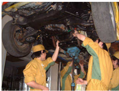
自動車工学科 授業風景