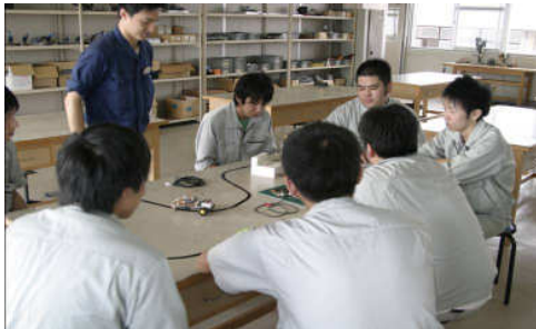
高松高等技術学校 電子システム科 授業風景