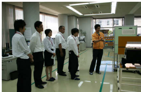
昨年度企業見学会：株式会社パル技研(施設見学)