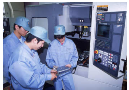
キャドシステム科 授業風景