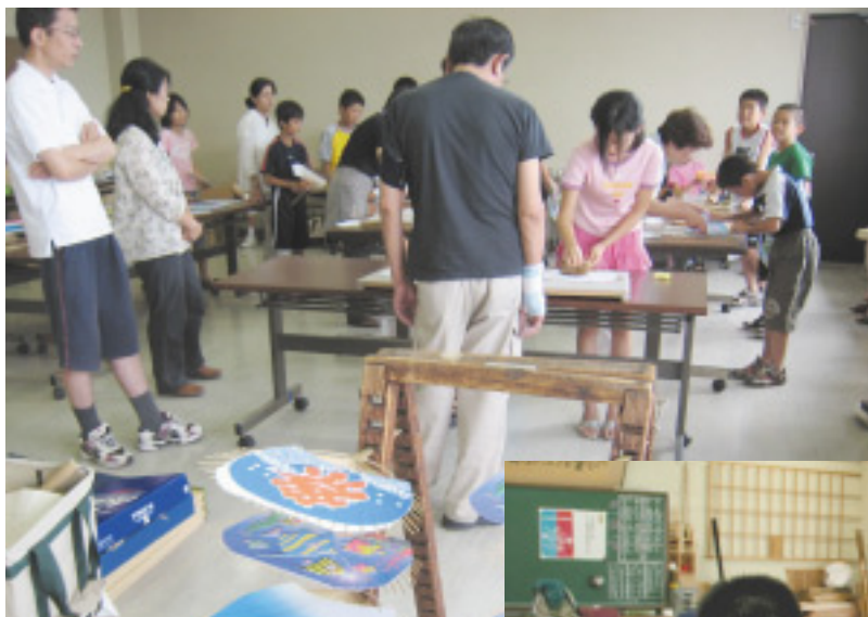
夏休み親子ものづくり技能体験教室 （香川地域職業訓練センター） 丸亀うちわの製作風景