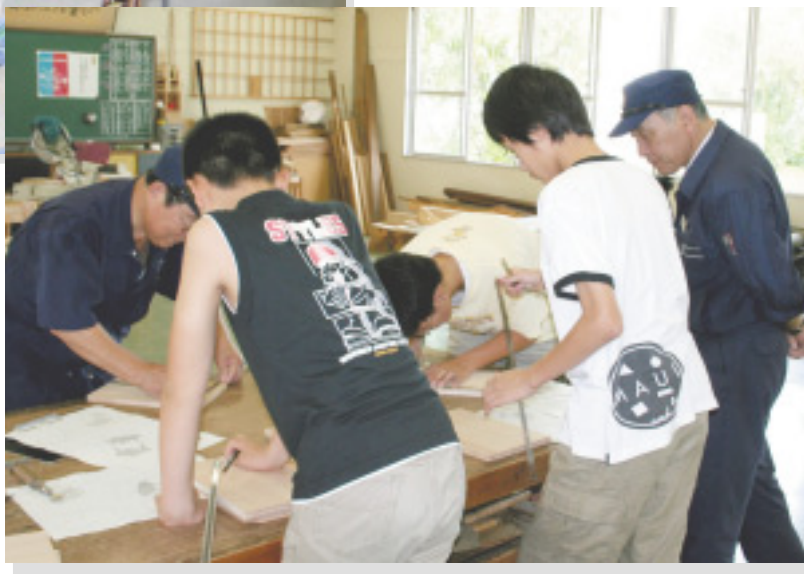
ものづくり教室（高松高等技術学校） ブックスタンドの製作風景