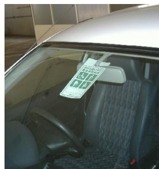
【写真③】駐車スペースの案内表示例