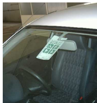
【写真③】駐車スペースの案内表示例