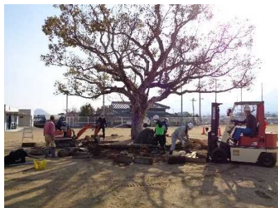
〔本校のシンボルツリー楠の再生事業〕

本校区の「地域学校連携本部」的な働きをもつ組織として、岡田コミュニティに「こども未来部」が創設され、様々な協働活動を展開して、教育活動を充実させている。その中で、校内緑化や環境整備も進められ、緑豊かで、季節の花々に彩られた美しい教育環境が整えられている。