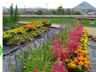
〔美しく咲き誇った庭園の花々〕