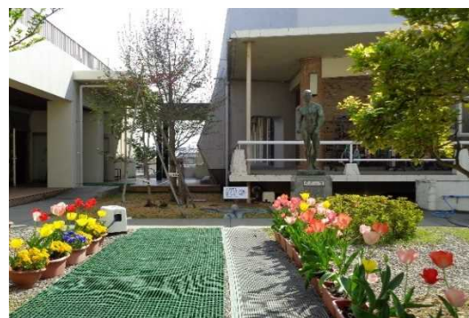
〔地域との交流で栽培したチューリップが彩る中庭〕