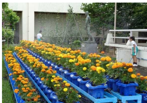
〔1人1鉢とグリーンカーテンに水やりをする児童〕

毎年、5年生が地域の方と「チューリップ交流会」を行い、開花時期を考慮しながら大切に育てている。咲き揃った花が、翌年度の入学式の会場や中庭を飾り、新入生を喜ばせている。