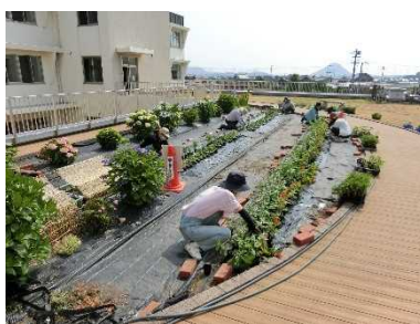
〔屋上庭園の植え替えボランティア〕