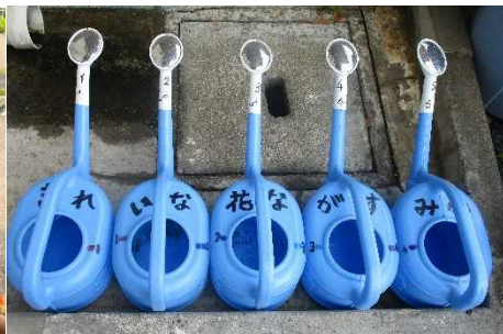
【きれいな花 長炭小】