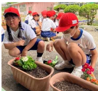
【6年生と一緒に(1年生)】

毎年、4年生が国営まんのう公園を訪問し、体験型環境教育を行っている。今年度も湿地に生息する植物の観察や採取方法を現地スタッフに教わり、それらを生かした作品作りをしたりすることで、普段あまり目にするのことがない植物の生態を見て触って体験しながら学ぶことができた。また、シイタケ菌を打ち込むことからシイタケ栽培に取り組んでいる。