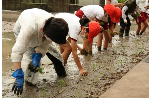
もみから育てた苗の田植え体験