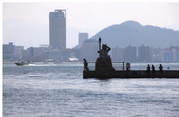
女木港からサンポート高松を望む

多くの観光客を迎える高松の海の玄関として、開放的な雰囲気が漂うサンポート高松が面白い。今日はここを起点に、高松市中心部の海景色を訪ねてみましょう。