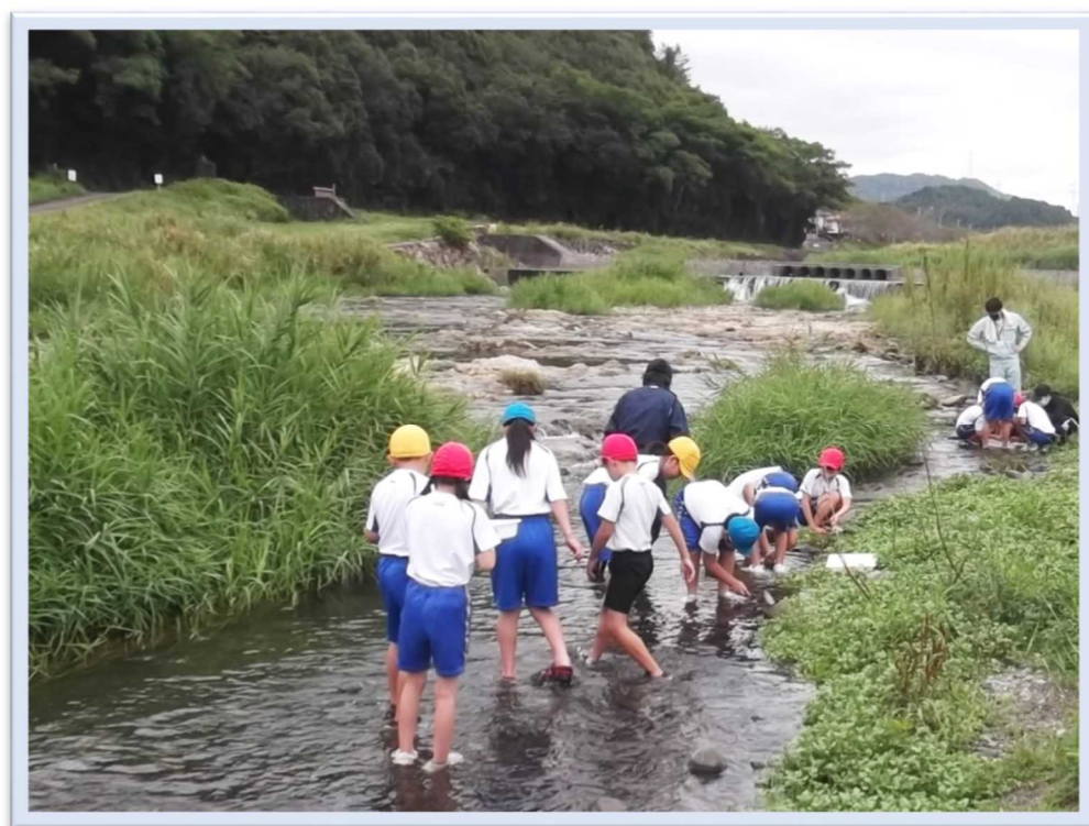
まんのう町立琴南小学校 「土器川」