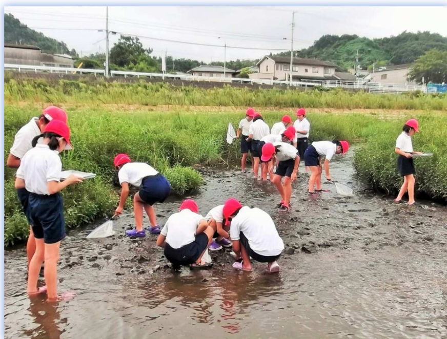
坂出市立府中小学校 「綾川」