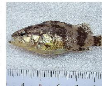
香川県水産試験場で人工生産されたタケノコメバルの幼魚。

(※3)香川県水産試験場が行ったある調査では、タケノコメバルは1973年には数多く漁獲されていましたが、1983年に1尾漁獲されたのを最後に獲れなくなりました。その後、1998年からタケノコメバルの生産試験が開始され、2002年からは毎年放流されています。