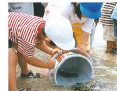
毎年数万尾を放流し、資源の復活を目指している。