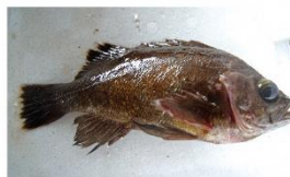
メバル。あまり獲れず、大きなサイズは県内飲食店などで扱う程度しかない。

浅瀬の岩場にじっとしていることから「磯の小魚の代表」「釣り入門編の魚」などと言われ、釣りを楽しむ人にはとくに親しみのある魚でしょう。メバルは一年中獲れ、「黒メバル」、「オキソメバル」などと呼ばれています。最近量は少なく高級魚で、30cm近い大きなサイズはとくに希少で、飲食店で扱う程度の流通量しかなく、なかなか一般には出回りません。よく似た魚で「赤メバル」と呼ばれるカサゴのほうが小売店などで見かける機会が多くなっています。