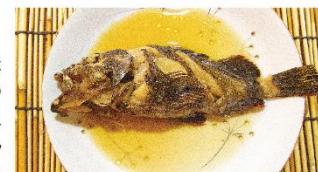
カサゴの煮付け。海の幸ふれあい市場には惣菜コーナーもある。

メバルやカサゴは身近な魚ですが、最近は香川県だけでなく、瀬戸内海全体で漁獲量が減少傾向にあります(※2)。そのような背景もあり、メバルに限らず乱獲にならないよう、海上に禁漁区域を設けたり、漁法によって禁漁期間を設定したりしています。また、温暖化による海水温の上昇も、影響しているように思います。