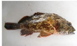
赤メバルと呼ばれるカサゴ。一般的に小売店で目にするのはほとんどがこのカサゴ。