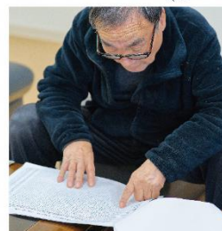
香川県魚市場が作成した香川で獲れる魚の評価。

数年前に漁師といっしょに、県内で水揚げされる魚の量や単価、味覚について5点満点でスコア評価しました。それを見ると、メバルは、3月、4月が量が多く味もよく、単価も高いことがわかります。メバルは1年中獲れますが、相対的に春に出回る魚ですね。