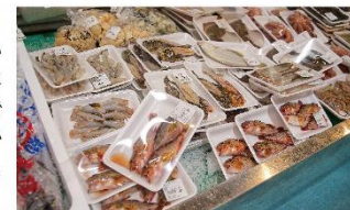
坂出「海の幸ふれあい市場」には新鮮な地魚がズラリと並んでいる。

味は淡白な白身魚で、身が骨からほろっと取れて、おいしい魚です。食べ方は、小さなものはそのままみそ汁に入れたり、丸ごと唐揚げにしたり。煮魚にしてもおいしいです。ただ、小さいメバルは小骨が多く、子供には食べにくいかもしれません。また、骨が多いので刺身には向かない魚です。(最後のページに「メバルのみそ汁」のレシピを紹介しています。)