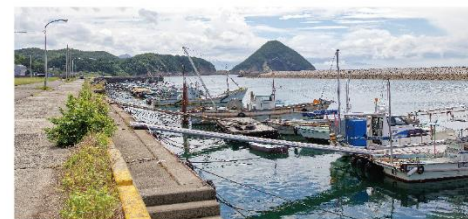
三豊市の観光名所、紫雲山のある荘内半島。大浜漁港はその中ほど、半島西側にある。奥に見えるおにぎり山は丸山島。