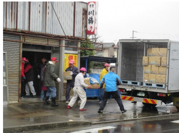
備蓄飲料水搬入作業

以上の骨組みにおいて地区防災計画を策定しましたが、平常時から約35名の会員が動き回っており、実践力が備わっていること、ただちに招集かけると集結できるマンパワーと東日本、熊本、真備町への災害支援による対応能力の良さはどこにも劣ることがないと自負しているところです。