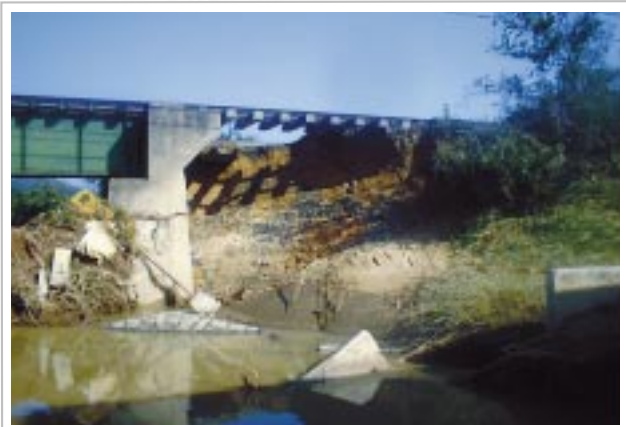
高德線神前・讃岐津田間(津田川橋りょう) 橋台背面築堤崩壊(台風23号)