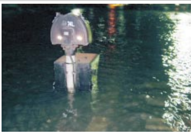
高潮による高松駅構内電気転轍機冠水(台風16号)