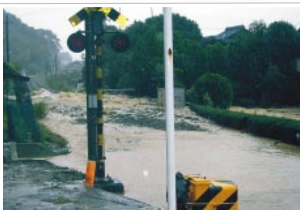
踏切器具箱冠水(台風23号)