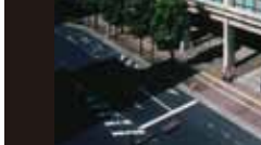
香川県庁舎 [1958年] TM 丹下健三