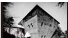
大学セミナーハウス [1965年] EK 吉阪隆正+U研究室