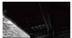
コアのあるH氏のすまい [1953年] EK 増沢洵