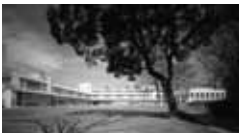
慶応義塾幼稚舎 [1937年] JS 谷口吉郎+會澤中條設計事務所