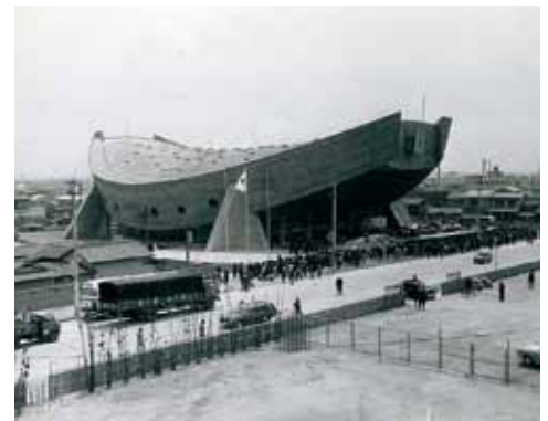
香川県立体育館[1964年]

また、瀬戸内各地に残る丹下建築は、地域で活動する建築家たちの発想を刺激し、多くの名作を生み出すことになった。瀬戸内の建築文化の有力な起点となったのである。