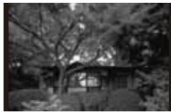
聴竹居 [1928年] JS 藤井厚二