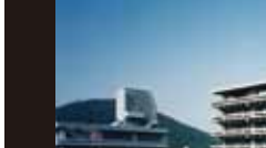
香川県庁舎 [1958年] TM 丹下健三