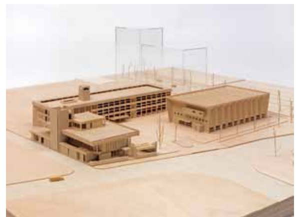
今治市庁舎・公会堂[1958年]、市民会館[1965年]模型