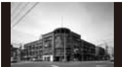
一連の同潤会アパートメントハウス [1926~34年、現存せず] JS (財)同潤会