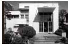
土浦亀城自邸 [1935年] EK 土浦亀城