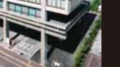
国立屋内総合競技場 [1964年] JS 丹下健三