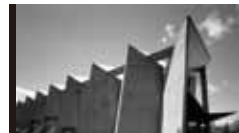
神奈川県立図書館・音楽堂 [1954年] EK 前川國男