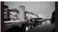
ハレスサイドビル [1966年] EK 日建設計(林昌二)