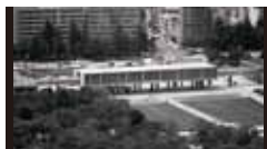
広島ピースセンター [1952年] EK 丹下健三 重要文化財