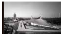
国立屋内総合競技場 [1964年] JS 丹下健三