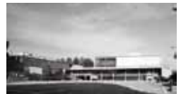
コアのあるH氏のすまい [1953年] EK 増沢洵