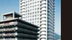
日土小学校 [1958年] JS 松村正徳