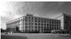
東京中央郵便局 [1931年、一部現存] JS 吉田鉄郎(通信省管轄課)