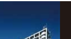
群馬音楽センター [1961年] JS アトキンソン・レモンド