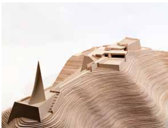
戦没学徒記念館[1966年]模型