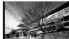
国立屋内総合競技場 [1964年] JS 丹下健三