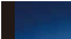
香川県庁舎 [1958年] TM 丹下健三