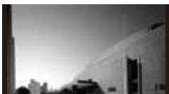
宇部市民会館 [1937年] JS 村野藤吾 重要文化財