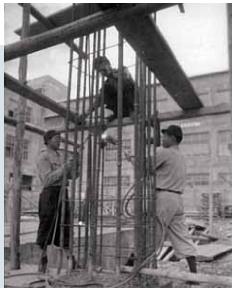
鉄筋の組み上げ [1956年]

中央の白い背広姿が金子正則香川県知事(当時)。そこから右に丹下健三、坪井善勝(構造設計)。金子知事は「民主主義時代の県庁としてふさわしいこと」、「観光香川の県庁本館としてふさわしいこと」などの設計条件を、丹下に示した。