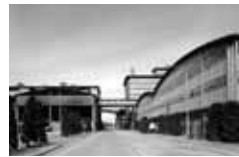
秩父セメント第2工場 [1956年] JS 谷口吉郎+日建設計