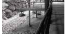
コアのあるH氏のすまい [1953年] EK 増沢洵