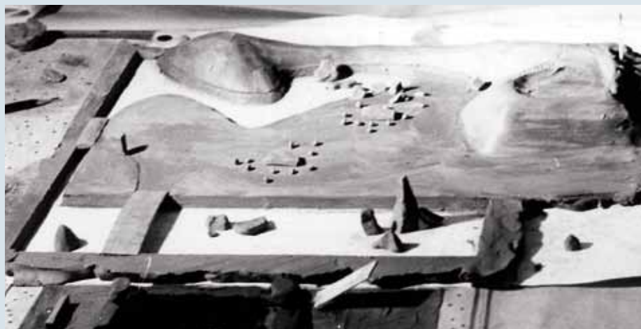
南庭のデザイン [1957年]

「豊穡のシンボル」として選ばれた県産の庵治石は、丁場から半日がかりで現場に運ばれ、池にすえられた。