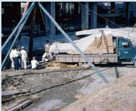
庭石を運び込む [1957年]

当時まだ極めて珍しかった異型鉄筋を使用することで、コンクリートの強度の向上が図られた。また、鉄筋(主筋)の継ぎ手がガス圧接されていることも、当時としては珍しい。施工にも先端技術が投入されたことがわかる。