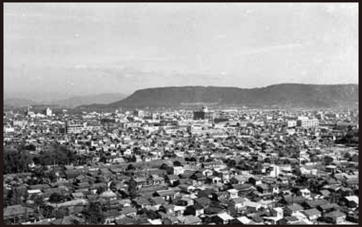
竣工当時の香川県庁舎(中央)と高松市街地[1958年]

1958年(昭和33)に竣工した香川県庁舎東館(旧本館・旧東館、丹下健三設計)。戦後日本を代表する建築として評価され、現在でも訪れる人が絶えないこの建築は、どのように構想・設計され、実現したのか。また、どのような価値をもっているのか。当時の図面やスケッチ、写真などの資料から追ってみる。