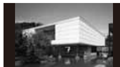
香川県庁舎 [1958年] TM 丹下健三