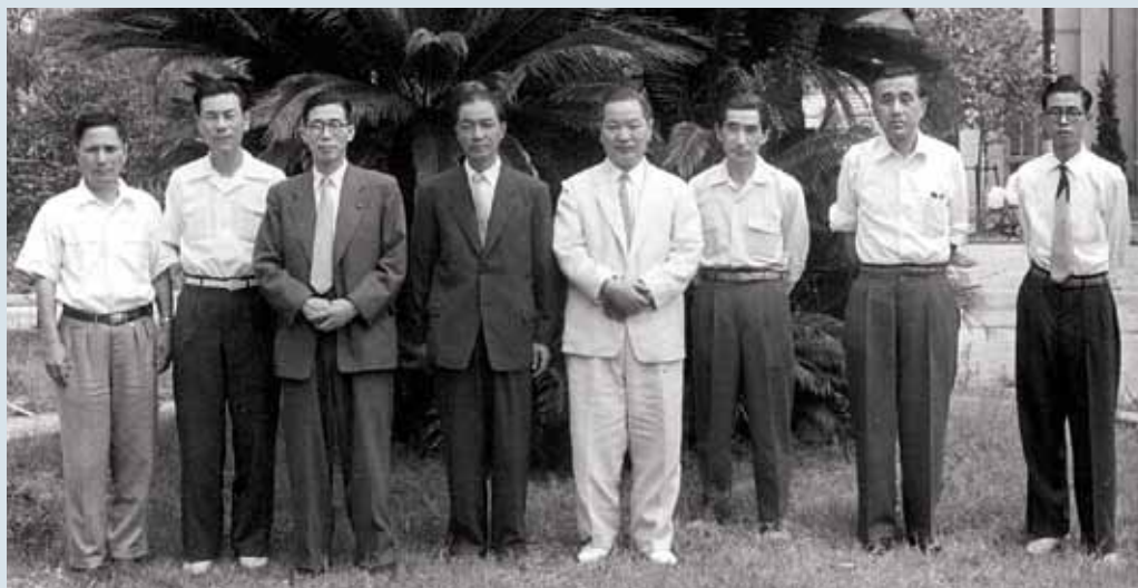
香川県庁舎建設関係者 [1955年]