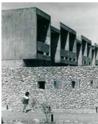
高松一宮住宅団地[1960～64年] 現存せず