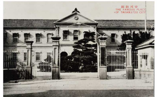
絵巻書香川県庁 昭和時代