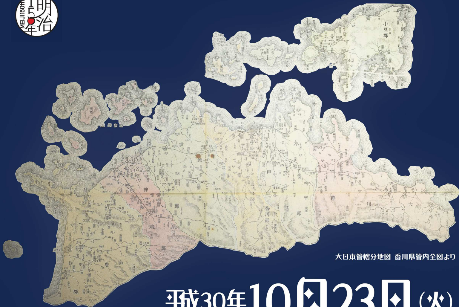
大日本管轄分地図 香川県管内全図より