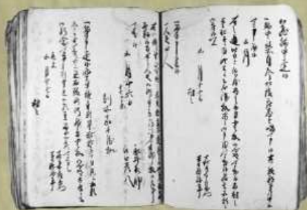
「文政六未年五月 御用留」 文政6(1823)年 別所家文書