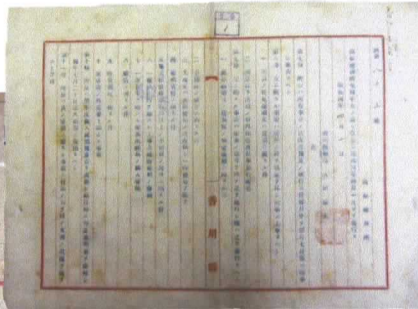
高松港務所規程改正 昭和4年4月1日 当館蔵