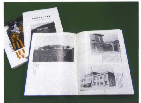
『香川県の近代化遺産』 香川県教育委員会編集・発行 他 当館蔵