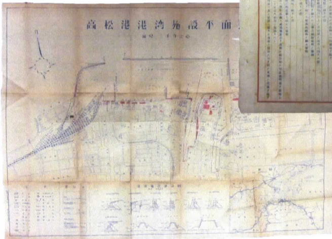
高松港湾施設平面図(1/3000) 昭和25年 当館蔵