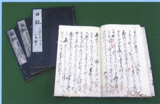
日記 (丸亀藩御連枝京極高周筆) 天保 15・弘化元年(1844) 白川武氏収集文書 当館蔵