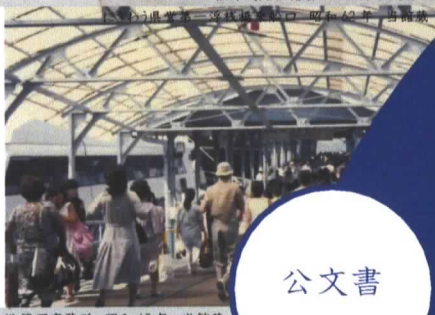
南正面から見た高松港管理事務所 昭和62年 当館蔵