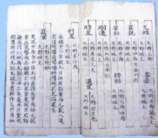
藤原姓大野氏系図 宝暦年中 (1751-1763) 大野家文書 当館蔵