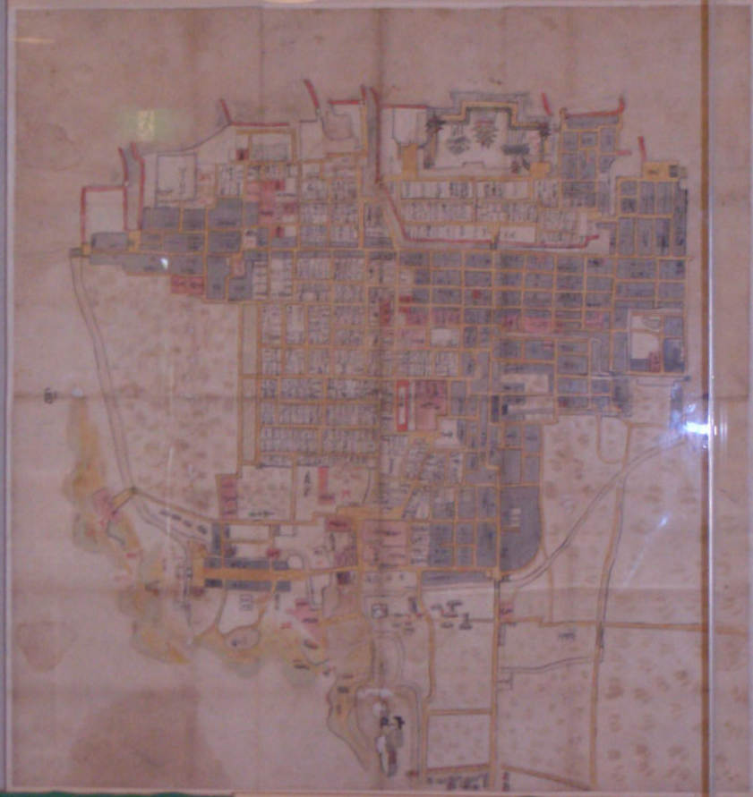
北京城图 明、清两朝北京城图，展示了北京城的布局，包括紫禁城、皇城、中轴线、以及城墙和城门。图中还标注了主要的宫殿、坛庙、王府、民居、以及运河和桥梁。图例说明了不同颜色和符号的含义。