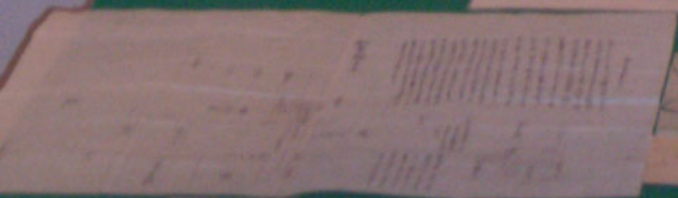
北京城图 明、清两朝北京城图，展示了北京城的布局，包括紫禁城、皇城、中轴线、以及城墙和城门。图中还标注了主要的宫殿、坛庙、王府、民居、以及运河和桥梁。图例说明了不同颜色和符号的含义。